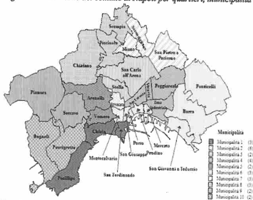
Fig. 1 – Articolazione del comune di Napoli per quartieri, municipalità e macro-aree

Nota: Centro storico = Chiaia, San Ferdinando, Mercato, Pendino, Avvocata, Montecalvario, Porto, San Giuseppe, San Carlo all'Arena, Stella, San Lorenzo e Vicaria; Collina = Vomero e Arenella; Est = Poggioreale, Zona industriale, Ponticelli, Barra e San Giovanni a Teduccio; Nord = Miano, Secondigliano, San Pietro a Paterno, Piscinola, Chiaiano e Scampia; Ovest = Posillipo, Soccavo, Pianura, Bagnoli e Fuorigrotta.